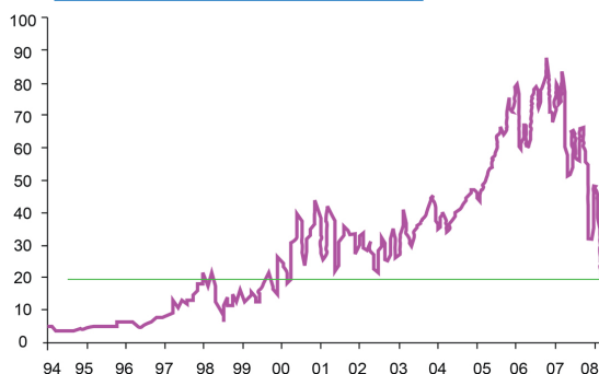
Lehman Brothers-тің (LEH) тарихтағы құны

2008 жылы Lehman компаниясы $7,8 миллиард шығынға батқандығы туралы мәлімдеді. Бұл акциялардың жаппай сатылуы мен акция құнының 95%-ға түсіп кетуіне себепші болды.