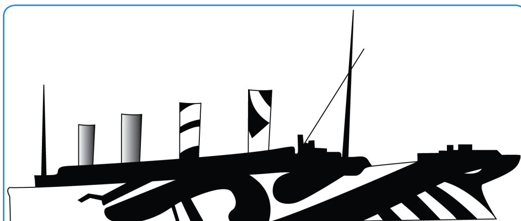
Ослепляющий камуфляж - это умное использование перспективы, так как насыщенные цвета затрудняют определение направления корабля.

Изучите, что такое скалярное произведение двух векторов, и как его можно использовать, чтобы показать, что два вектора перпендикулярны. Дайте векторную линию линейного корабля для вычисления выражения для вектора, перпендикулярного этой линии.