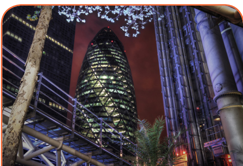
Қаланың құрылымы күрделі және жүйеленген