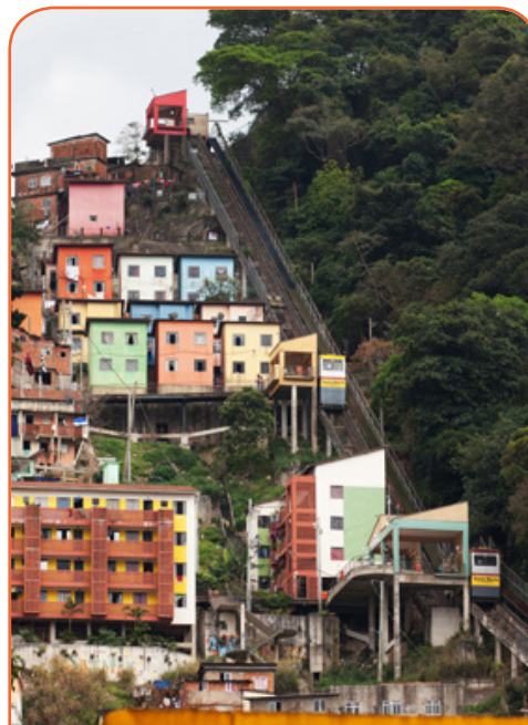
Лашық үйлі қалашықтар кейбір қалалардың сыртында пайда болады

Қаланың өсуіне байланысты туындайтын бірқатар мәселелер бар. Олар білімге, денсаулық сақтауға, қызметтер мен көлікке қатысты. Қала өскен сайын жолдағы кептелістер саны мен жұмыс орындарына деген бәсекелестік артады. Кенже дамыған елдерде қала өсуімен туындайтын мәселелер көбірек болады, себебі мұндағы инфрақұрылымдар мен қызметтер мөлшері шектеулі.