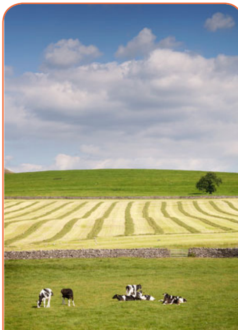
Қала шетіндегі ауылдық жерлер – өнеркәсіптерін кеңейтушілер үшін қолайлы жер

Қараусыз қалған жерлер – ертеректе құрылыстар салынған орындар. Жабылған зауыттар немесе бұзылған тұрғын үй құрылыстары қалалардың көпшілігінде бар. Бұл жерлердің негізгі артықшылығы – олардың көпшілігі жол мен коммуналдық қызметтерге қосылғандығында. Кемшіліктерінің бірі – егер бұл аймақ өнеркәсіп үшін қолданылып, ал жаңа үйлер тазаланбаған жерде салынған болса, өндірістен қалған химиялық заттар мәселелер тудыруы мүмкін.