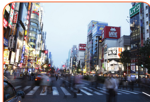
Жапониядағы Токио – 35 миллион адам өмір сүретін мега қала

Барлық елді мекендер жер бетінде өз “ізін” қалдырады. Қаланың физикалық қалдық ізі ғимараттардың нақты салынған шекарасымен шектеледі. Басқа қалдық іздердің бірі – экологиялық қалдық ізі – адамдардың табиғат пен ресурстарға деген сұранысының өлшемі, және оның қалдық ізі қаланың шекарасынан да асып кетеді. Қалаларда энергия, су, азық-түлік және өзге де ресурстар көп мөлшерде тұтынылады. Сонымен қатар, адамдар ауылды жерлерден қалаға қарай ұмтылады (тұрақты түрде қаланы кеңейте түседі), нәтижесінде қалдық ізі де уақыт өте өзгеріп отырады. Қаланың қалдық ізі “белгілі” аймақ емес, ол әртүрлі есептеулер жүргізе отырып, болжам жасау арқылы табылады.