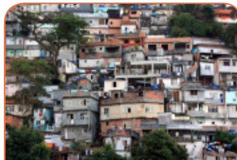
Лашық үйлі қалашықтар қоғамдық инфрақұрылымдары жоқ, қызметтер көрсетілмейтін жерде дамиды

Бұл – әлем қалаларының көпшілігінде алуан түрлі формаларда кезігетін спонтанды аймақтар. Жақсы өмірді аңсап, іздеп келген мигранттар ең алғаш қалаға келгенде нашар үйлерде тұруға мәжбүр болады. Бұл үйлер жел өткізетін, арзан, қолда бар материалдардан тұрғызылады. Енді ғана дамып келе жатқан лашық үйлі қалашықтар қызметтермен қамтылмаған. Уақыт өте келе, бұл жерлерде өмір сүретін қауым қалашықты жақсартуы мүмкін, алайда көп жағдайда олар қылмыс пен зорлықтың ортасы болып қала береді. Ең қызығы, кейбір жүргізілген зерттеулер бойынша бұл жерлерде өмір сүретін халық анағұрлым бақытты әрі өз өмірлеріне дән риза.