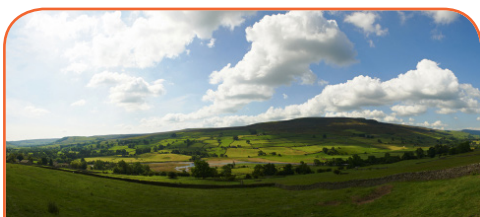
Әр күн сайын жүз мыңдаған адам ауылды жерлерден қалашықтар мен қалаларға қарай көшеді