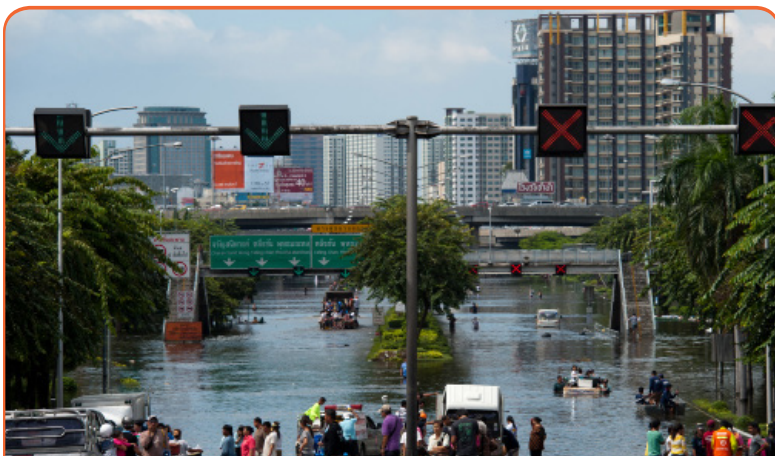
Тяжесть и частота сезонных наводнений увеличится по мере повышения температуры

Изменения в режиме осадков и засуха могут создать угрозу для сотен миллионов людей по всей Африке, и также может пострадать урожайность культур в Южной Азии. Изменение среды обитания влияет на многие виды растений и животных. Страны, которые полагаются на ледники и талые воды для их водоснабжения, в том числе такие города, как Ла-Пас в Боливии, также будут затронуты.