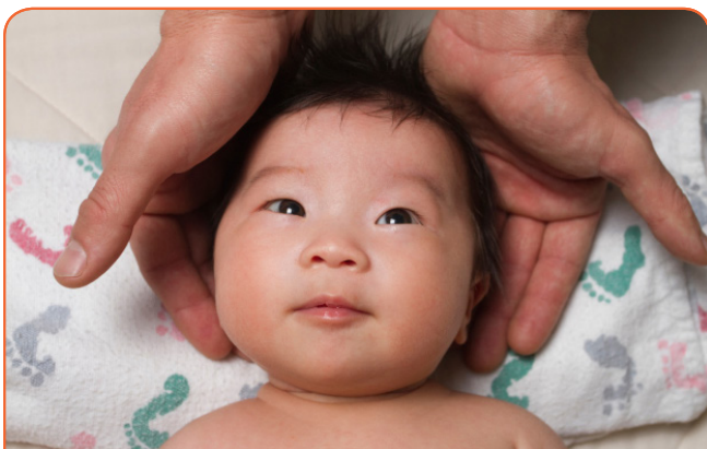
Китай ввел Политику одного ребенка как попытку замедлить темп роста населения

“Политика одного ребенка” - это термин, используемый для описания целого ряда мер, которые были введены в Китае на протяжении ряда десятилетий в попытке замедлить быстро растущее население, которое угрожало его способности прокормить себя. Политика была введена в 1970-е годы после того, как предыдущие кампании, которые призывали людей вступать в брак позже и удлинять промежутки между рождением детей в семье, не смогли замедлить рост населения. Как следует из названия, для большинства пар есть предел в виде возможности родить только одного ребенка, если они не хотят подвергнуться строгим финансовым санкциям. Китайские традиции гласят, что приоритет в семьях должен отдаваться сыновьям, а не дочерям, и внедрение Политики одного ребенка привело к увеличению количества брошенных девочек, что нарушает гендерный баланс населения Китая.