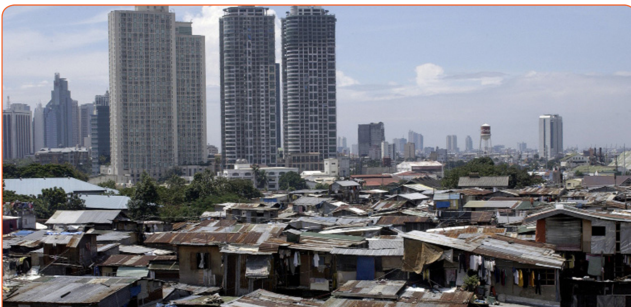
Манила, столица Филиппин, представляет собой мегаполис с более чем 12 миллионами жителей

ООН отправился в Манилу 31 октября 2011 года, чтобы задокументировать рождение семимиллиардного человека на планете. Это подчеркивает быстрый рост этой области и ее значимость для глобальных тенденций.