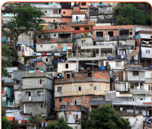
Условия жизни в фавелах стеснены и лишены многих удобств

Экономика Индии, как и Китая, быстро растет. Страна является членом большой двадчатки G20, а также является одной из стран БРИК (Бразилия, Россия, Индия и Китай), представляющий собой группу стран с развивающейся экономикой. Здесь есть несколько основных фирм, таких как Tata, которая работает в целом ряде отраслей, и Mittal Steel, являющийся одним из крупнейших мировых компаний. Экономика Индии росла быстрее, чем большинство других в течение 2011 года, частично из-за низкой стоимости рабочей силы, привлекая множество зарубежных компаний в такие города, как Бангалор.