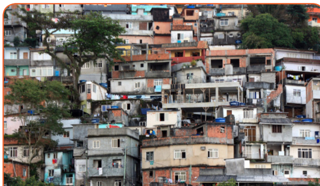
Рост населения выше в менее развитых странах

В конце октября 2011 года Организация Объединенных Наций официально объявила о рождении семимиллиардного человека на планете. Для некоторых людей это был знак того, что население мира продолжает неуклонно расти, и мир перенаселён. Эта проблема также была поднята в 1999 году, когда в мире родился шестимиллиардный человек, так что, чтобы ответить на этот вопрос, мы должны определить, что именно подразумевается под выражением “слишком много людей”. Мы все еще можем производить достаточно пищи, чтобы прокормить каждого человека на планете, но она распределяется неравномерно. Некоторые места перенаселены, в то время как другие области являются малонаселенными. Вполне могут быть некоторые места, которые переполнены, но могут быть и другие малонаселенные места.