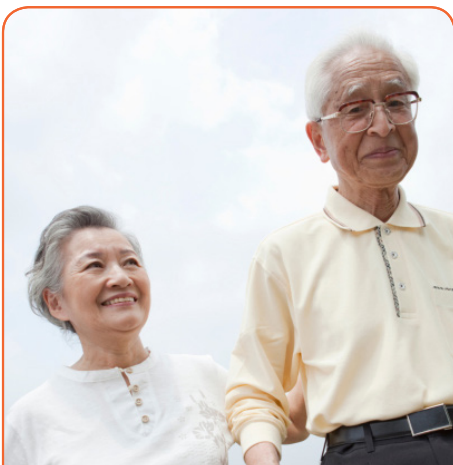
20% населения Японии старше 65 лет