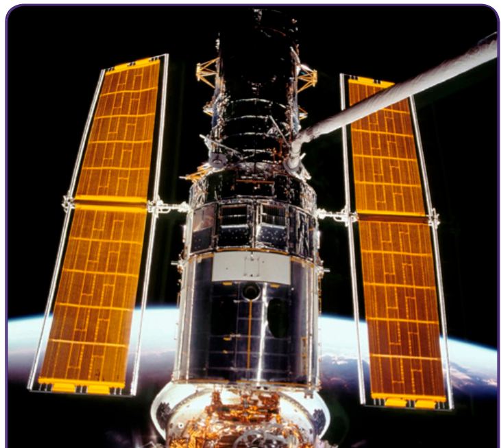
Космический телескоп Хаббл

Эдвин Хаббл - американский астроном. В начале 1920-х гг. Хаббл доказал, что некоторые звезды расположены далеко за пределами нашей галактики на Млечном Пути. Это открытие разрешило спор о том, что вся Вселенная состоит только из Млечного Пути, как это было принято считать в то время. Он также проанализировал красное смещение галактик, что привело к Закону Хаббла. В 1983 году предлагаемый Большой космический телескоп был переименован в Космический телескоп Хаббла, в знак признания вклада Эдвина Хаббла в астрономию. Телескоп был запущен в 1990 году и будет функционировать до 2014 года.