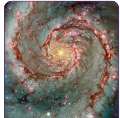
Во Вселенной существуют миллионы галактик, например, Галактика Водоворот M51