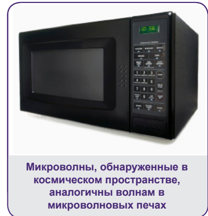
Микроволны, обнаруженные в космическом пространстве, аналогичны волнам в микроволновых печах